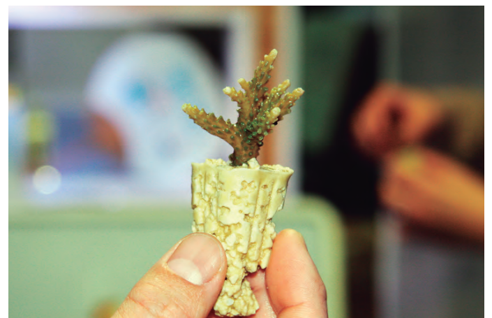
植え付けのためのサンゴ株