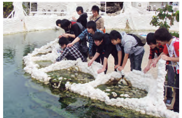
施設内には大きな池がいくつかあり、水面から成長したサンゴやそこに住む魚などを観察できます