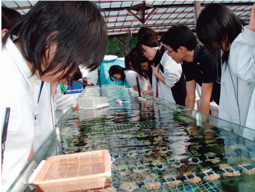
育成中のサンゴ株の見学

移植放流用サンゴを育てていて、様々な種類のサンゴを間近に見ることのできる施設「サンゴ畑」（有限会社「海の種」運営）を借りて、サンゴの生態を伝えるガイドツアーをおこないます。