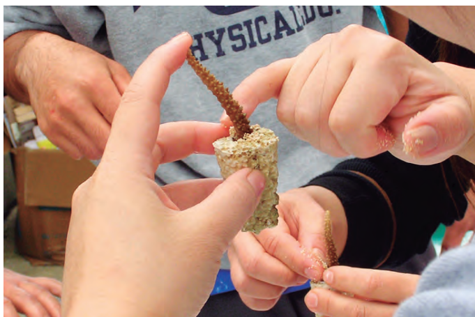
サンゴ株分け体験