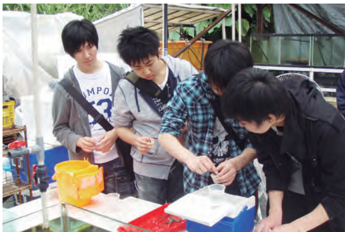
サンゴ株分け体験