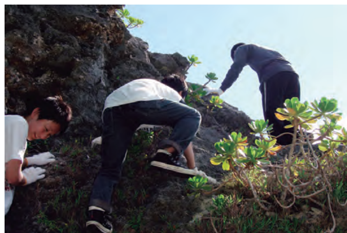
両手両足を使ってよじ登るコースも選択可