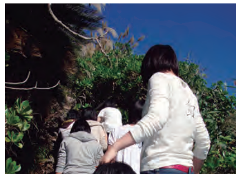
海岸植物のあいだを歩く

起伏に富んだサンゴ礁の自然海岸を両手両足を使ってよじ登ったりくぐり抜けたりしながらトレッキングするプログラムです。隆起サンゴ礁や海岸植物や砂浜など、サンゴ礁地形の様々な要素を体感することができます。