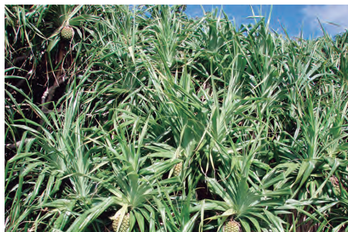
海岸に生い茂る“アダン”