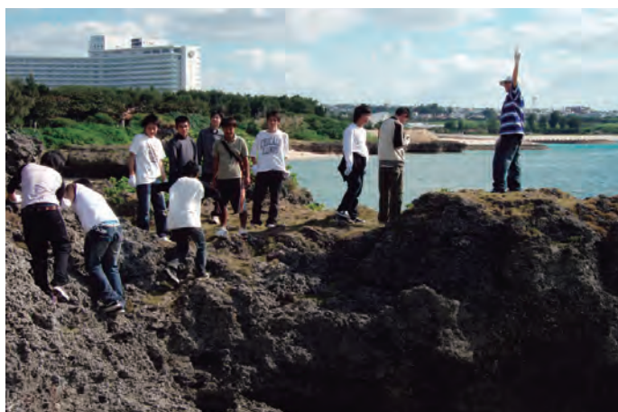
途中で休憩したり地形の説明を聞いたりしながら進む