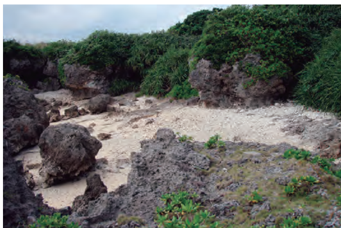
フィールドであるサンゴ礁の自然海岸