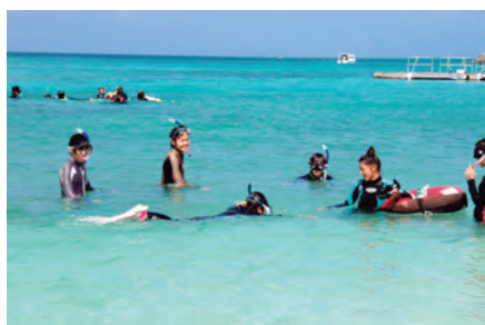
フロートを持ったインストラクターが小グループで講習