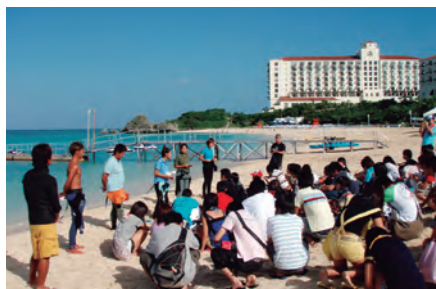
全体説明＆準備運動