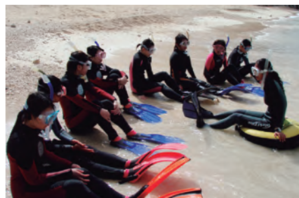
ビーチでのフィン・マスク・スノーケルの特性、使い方講習