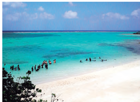
グループごとにスノーケリングスキル講習

スノーケリング講習と自然観察のコースです。安全にスノーケリング器材を使えるようになるまで丁寧に講習を行ってから、水中自然観察に出かけます。ビーチから少し泳ぎ出るだけで、サンゴ礁の生き物たちの暮らしを間近に見ることができます。