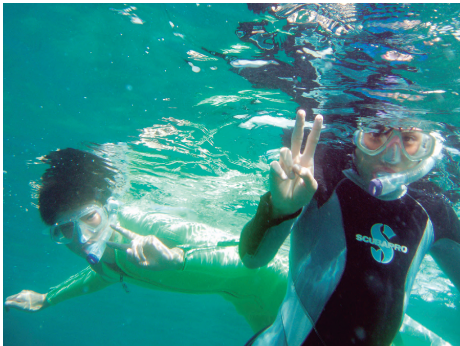
スノーケリングで快適に水中自然観察を楽しむ

施設使用料別途：更衣室・シャワー代 500 円 キーワード：スノーケリング・生物観察・スキル習得