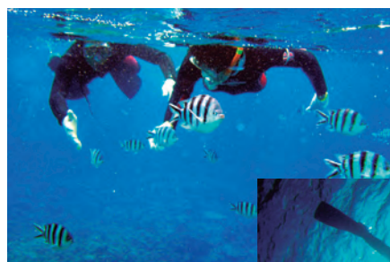
スキル習得後、インストラクターとともに自然観察